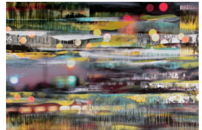
oben: 871 | Panorama, 50 x 130 cm, 2007 unten: 778 | Sommernacht, 100 x 150 cm, 2006