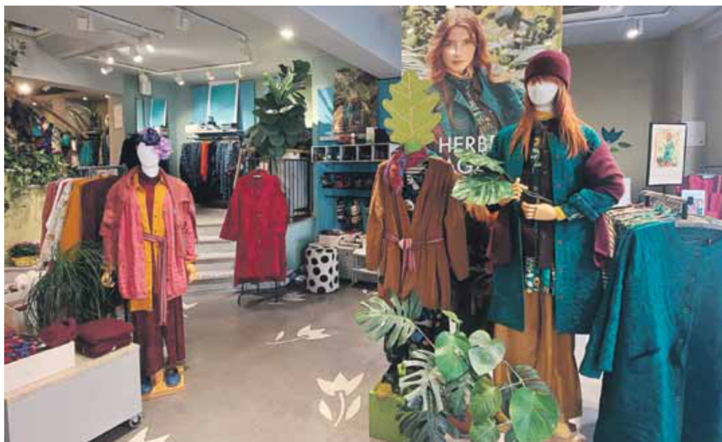
Farbenfrohe Akzente im Freiburger Konzeptladen

Sjödéns Entwürfe sind für Frauen jeden Alters gedacht und zeichnen sich durch legere Schnitte und farbstarke Muster aus. Im Zentrum steht zeitloses