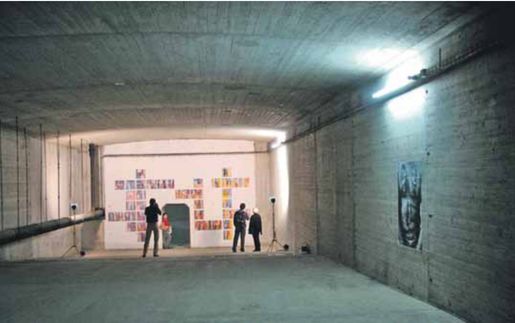
Rosa Lachenmeier: „Deutzer Brücke“