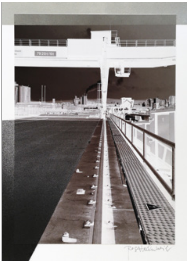
Kraftwerk Rheinfelden , 2022, WVZ 1478, Spray über Fotografie auf Papier, je 24,5 x 33, in PP 40 x 50 cm, aus der Werkgruppe: Rhein – Brücken – Reise .